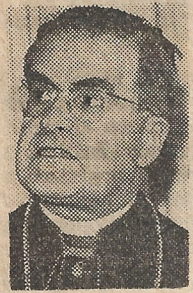
Julius Kardinal Döpfner

An die Öffentlichkeit waren die strenggläubigen Partisanen erstmals beim Deutschen Katholikentag in Essen getreten. „Weg mit Alfrink und seinesgleichen aus dem Bischofsamt“, hatten die Münchner in der Essener Innenstadt plakatiert. Die katholische Kirche der Niederlande stellte sich vor ihren Kardinal und bat